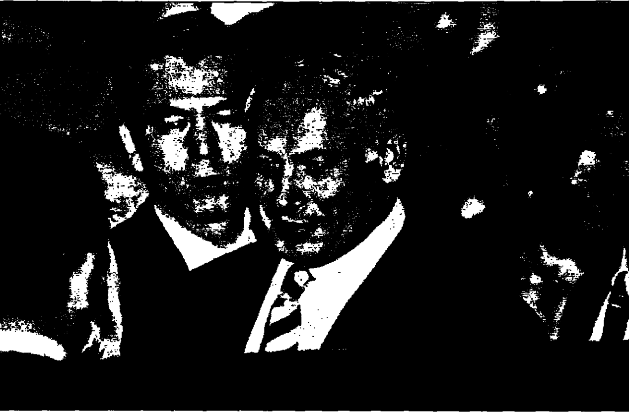
رئيس الوزراء الاسرائيلي بنيامين نتانياهو مع محافظ اربيل الاسرائيليين واليابانيين لدى وصوله مطار طبريز اس (ريتر)

وقال التلفزيون ايضا ان مستشارا خاصا للرئيس الامريكاني بيل كلينتون قام مؤخرا بزيارة لاسرائيل لبحث مع مسؤولين في وزارة الدفاع بشأن هذا الملف. ومن جانب آخر أكد نتانياهو لثلاثي اسرئيليين من وفد اسرائيليين انهم سيبحثون مع مسؤولين في وزارة الدفاع الاسرائيلية بشأن تسليح ايران والصين. وقال نتانياهو ان اسرائيل ستستمر في تطوير قدراتها النووية حتى تتمكن من الرد على أي تهديد نووي.